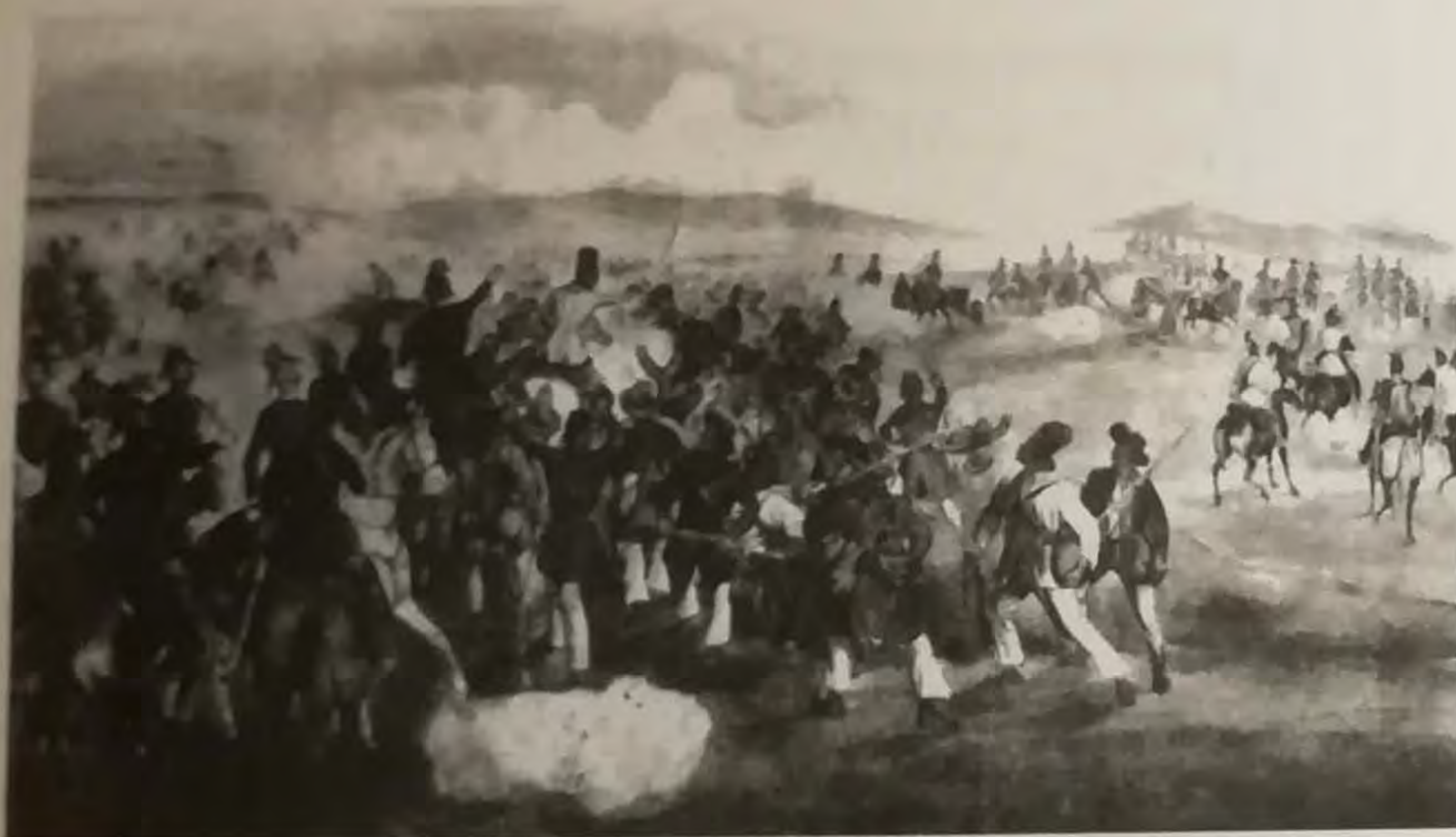
Lupta din Alibunar la 12. decembrie 1848, sub comanda lui Ianoș Damianovici, contra sârbilor în Ungaria de sud.

Preoții pe timpuri erau aproape unici intelectuali și-n localitățile în care nu aveau dascăli învățau copiii să scrie, să citească, să socotească.