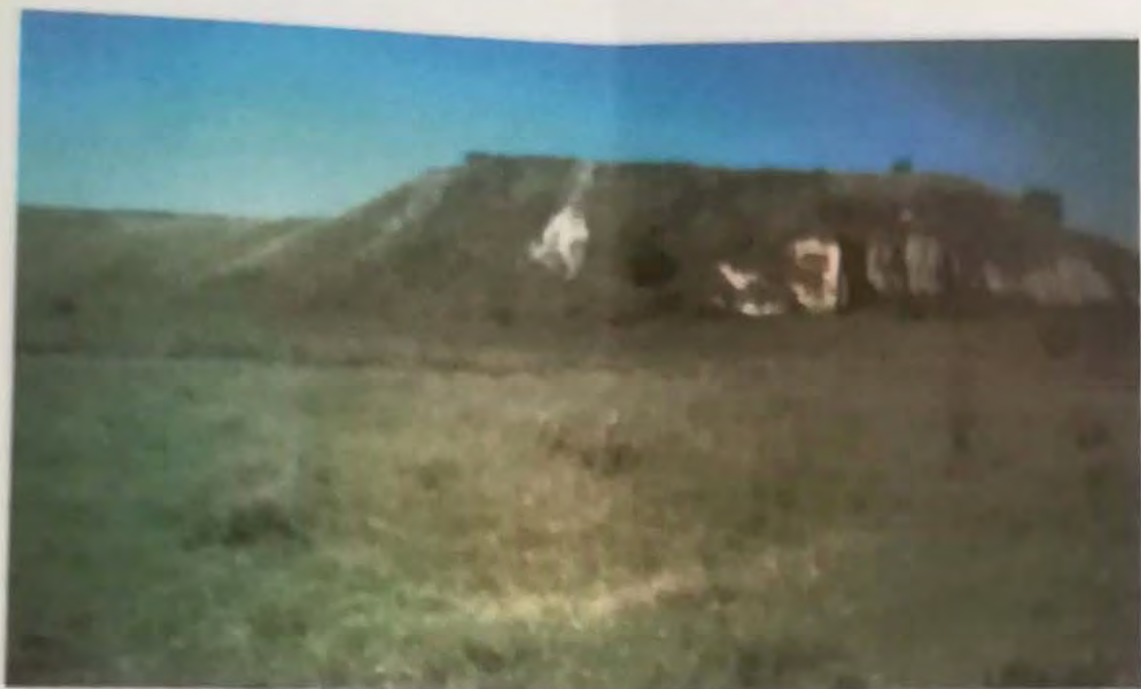
Dealul Jidovar de lângă Oreșat Platoul pe care s-au efectuat săpăturile arheologice la Jidovar

Aici se scot cu ocazia aratului holdelor, cu plugul, bucăți de cărămidă cu inscripția cohortelor IV (Flavia), VII (Claudia), XIII (Gemina), V (Macedonica), din zidurile vechi a unor vestigii dacice și romane, precum la fabrica de bere din Panciova, despre care am amintit mai sus.