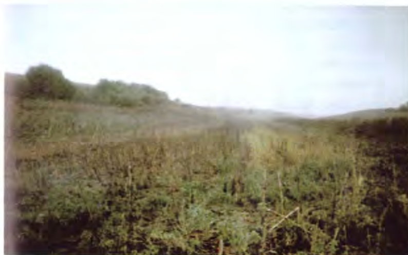
Valea afundă, între Dobrița și Padina

Nu pot ca să nu destăinuiesc tot ce știu și am văzut. Într-un film sovietic de pe vremea când eram elev la liceul român din Vârșeț, în care îi arăta pe soldații români din Războiul II Mondial, în Rusia ca pe niște hoți de găini, ceea ce știm sigur e că rușii ne-au furat Cloșca cu tot cu puii de aur. Or fi or nu românii hoți, dar cum au ajuns acești hoți români la Stalingrad, pe când ceilalți, finlandezii împreună cu germanii, ungurii stăte-au în fața Moscovei, fără să înainteze deloc.