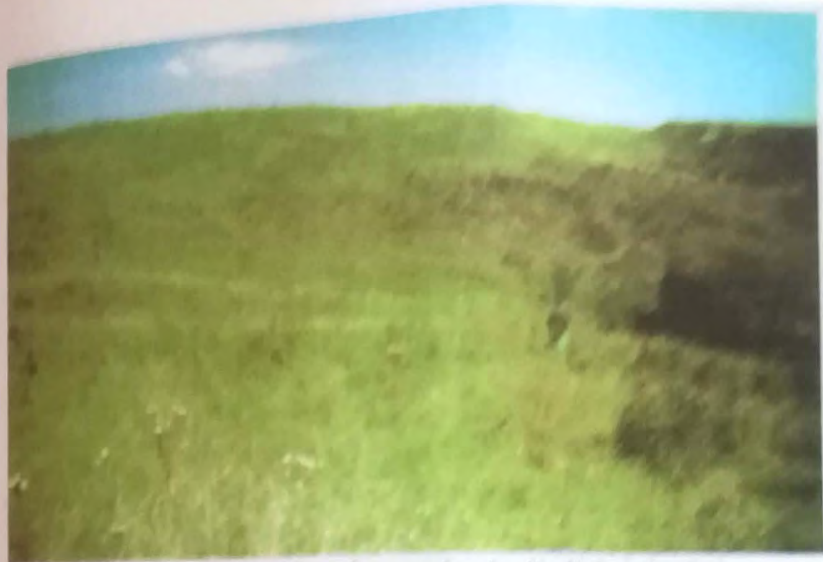
Vedere generală a împrejurimii Jidovarului