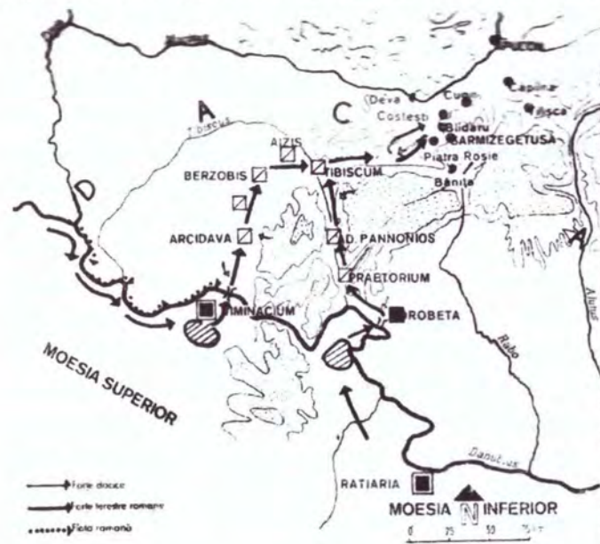
Harta privind prima campanie din anii 101 – 102

Înainte de prima și a doua ciocnire de la Tapae a fost lupta de la Turnul Roșu în care