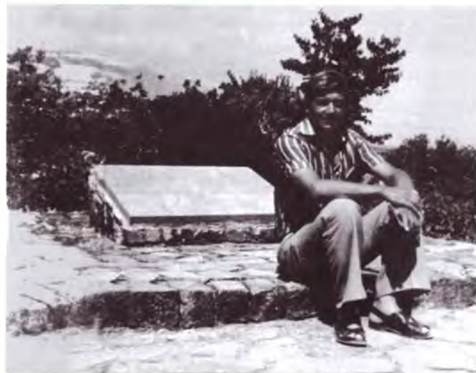
Termopile – mormântul Împ. Leonida

Vitalian a fost chemat cu înșelăciune la Constantinopol și ucis. După moartea lui imperiul indigenilor „cu căciuli și boi mulți”, romanici creștini vechi romani, se destramă. Romeii „bizantini grecizați” îi împrăștie până în Elada, pe râul Savos (Sava), chiar și până pe muntele Sinai