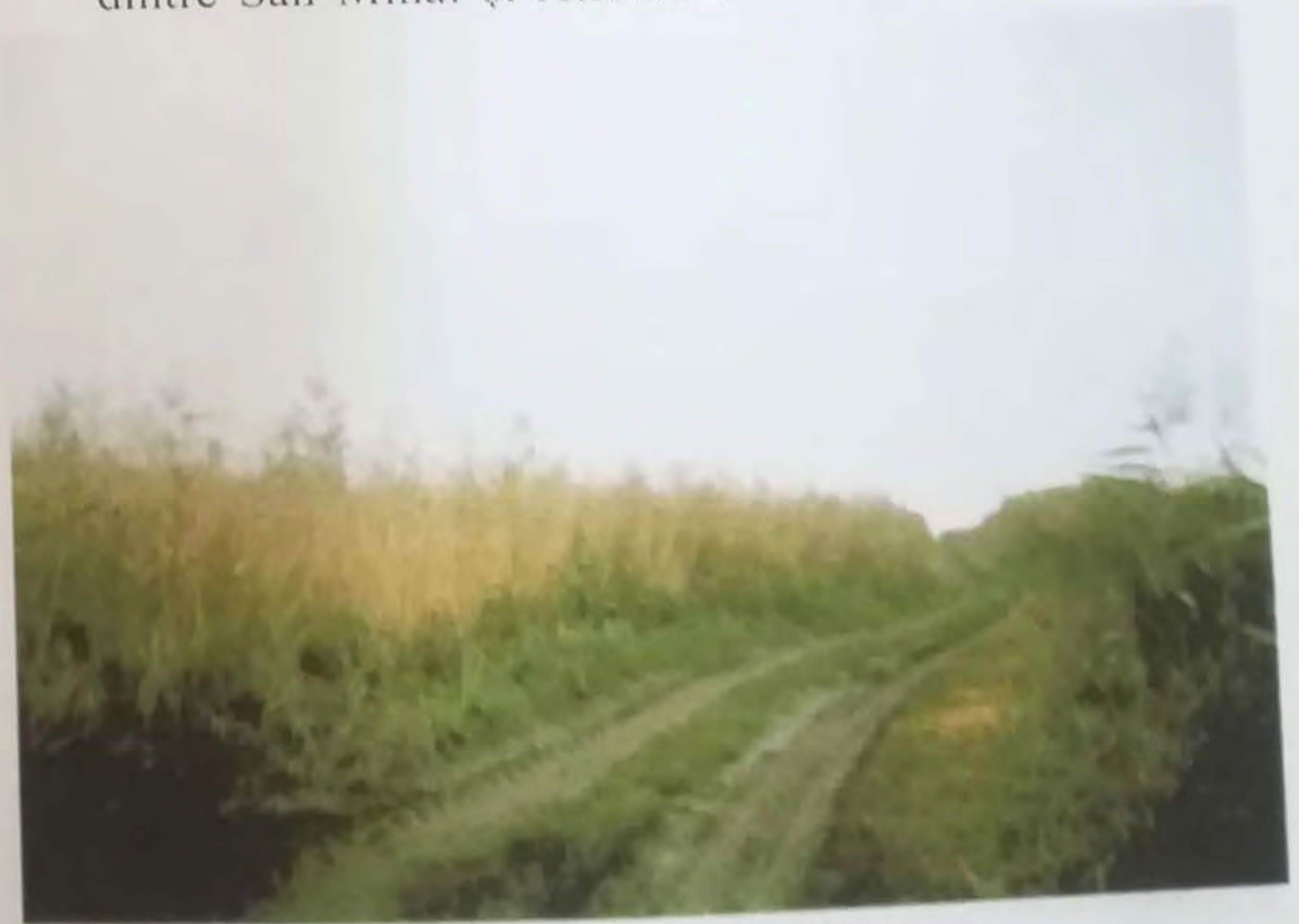
Valul lui Traian la Alibunar

Un astfel de val de apărare, la noi în Banatul sârbesc, merge de la râul Bega până la Căraș, altul de la Alibunar, care se vede până astăzi în hotarul dintre Sân Mihai și Alibunar.