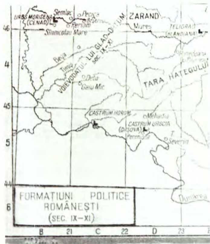
37. Voievodatul bănățean în sec. IX-XI

Împăratul Decius (249 – 251) se apăra de