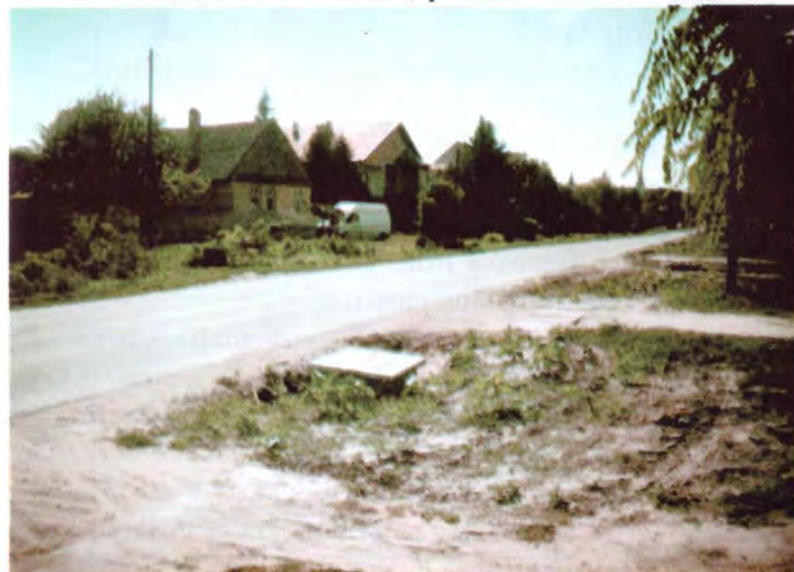
Casa lui Paia Novac, pe Valul lui Traian