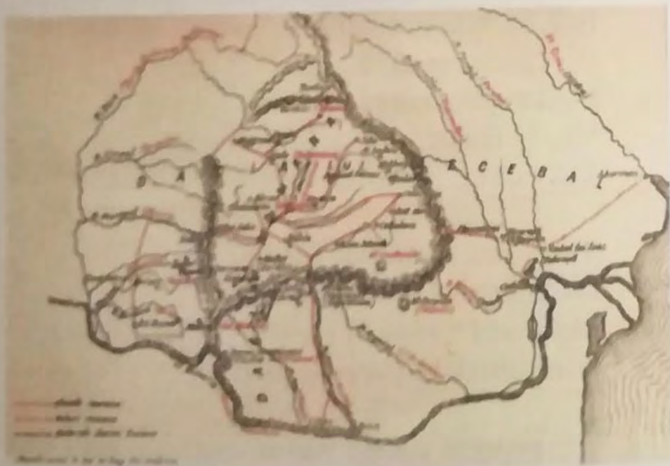
Harta drumurilor și valurilor daciei romane Șosele romane Valuri romane Hotarele Daciei Traiane